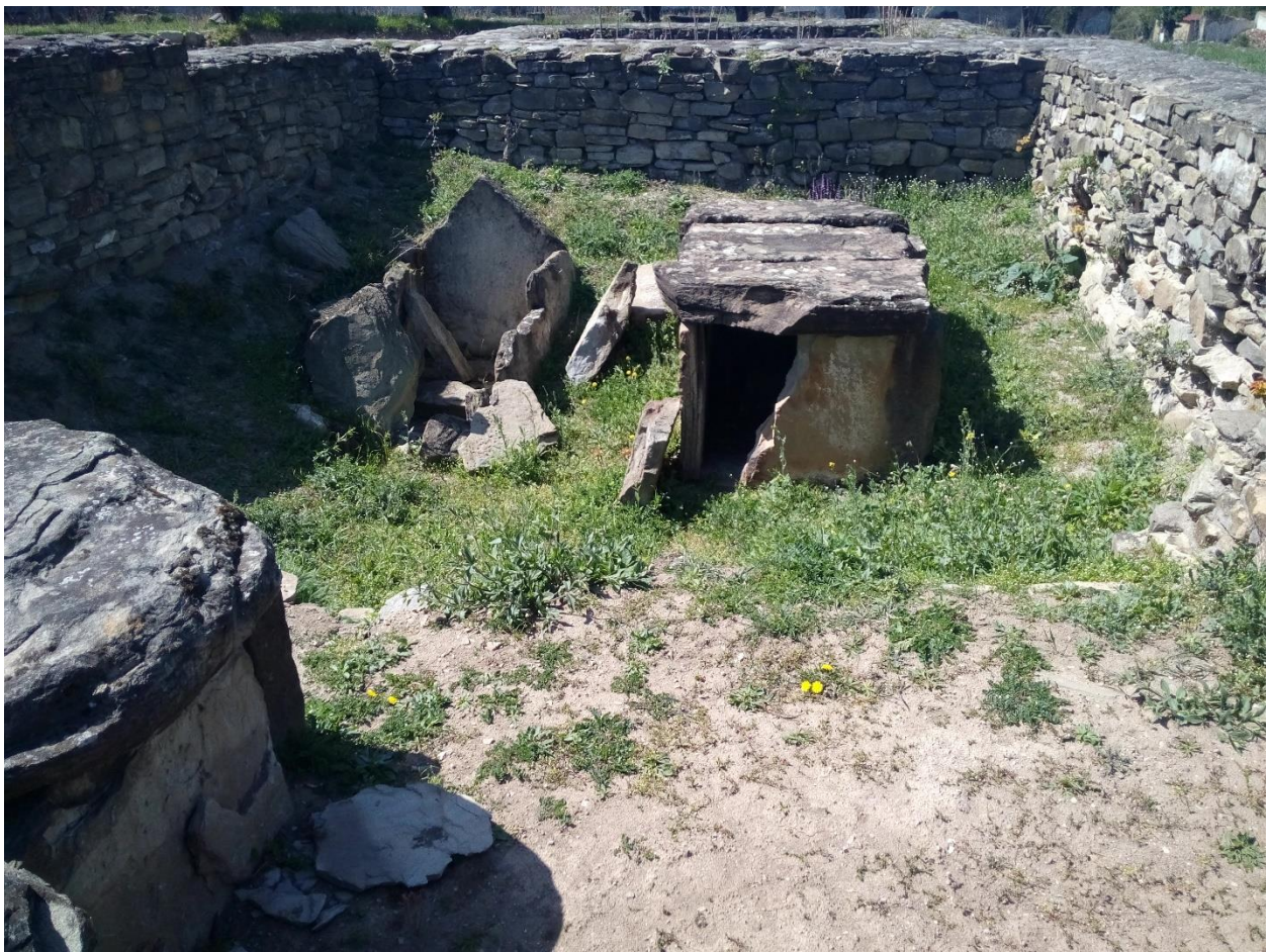
ასფაგურ პიტიახშისა და კარპაკის სამარხები

თავის მხრივ, სერაფიტას მამა ზევახი მცირე პიტიახშია. სათანადო ფაქტების უქონლობის გამო არ ვიცით, სად არის დაკრძალული ეს ზევახი. არმაზისხევში მისი სამარხი არაა. ანუ შეიძლება ვიფიქროთ, რომ მცირე პიტიახშებს საკუთარი ნეკროპოლი ჰქონდათ? მაშ, რატომაა მისი მეუღლე დაკრძალული მამის გვერდით და არა მის გვერდით?